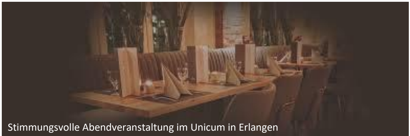
Stimmungsvolle Abendveranstaltung im Unicum in Erlangen