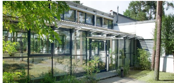
FAPS Forschungsstandort Erlangen

Friedrich-Alexander-Universität Erlangen-Nürnberg Lehrstuhl FAPS Egerlandstraße 7-9 91058 Erlangen