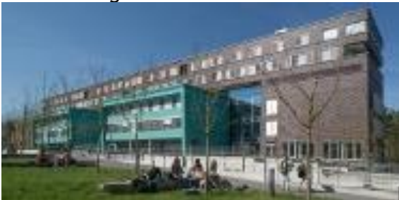
Chemikum FAU Department Chemie und Pharmazie

Friedrich-Alexander-Universität Erlangen-Nürnberg Chemikum Nikolaus-Fiebiger-Straße 10 91058 Erlangen